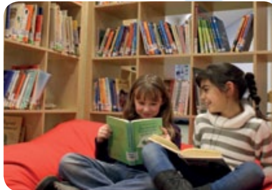
Der Förderverein unterstützt die Einrichtung des Lesezimmers durch Bücherspenden.

Kreis der Freunde und Förderer der Uhland-Grundschule e. V. Geibelstraße 6, 68167 Mannheim Tel. 0621-293 57 20 Fax 0621-293 57 30 Bankverbindung: IBAN: DE17 6709 0000 0085 6500 09 BIC: GENODE61MA2 VR Bank Rhein Neckar eG