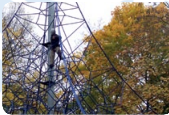
Der Förderverein finanziert Dauerparkkarten für alle Schulkinder in den Luisen- und Herzogenriedpark.